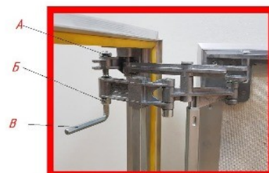
Рис.3 Регулировка по высоте