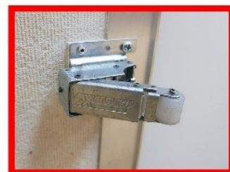
Рис.2 Замок без фиксатора