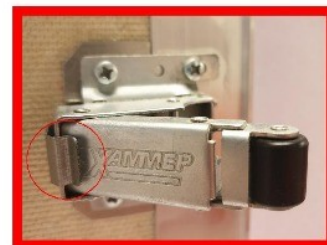
Рис.1 Замок с фиксатором