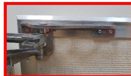
Рис.4 Регулировка диагоналей